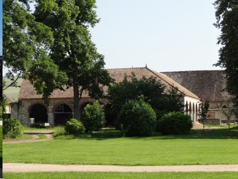
Les anciennes dépendances

Pour la zone en rose foncé dans le périmètre de 500m