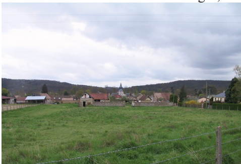
Le village de la Croix Saint Leufroy

Les avis seront cohérents avec ceux émis ces dernières années, à savoir : pas de maisons à volume compliqué (type V, W, Y, ou Z), pentes à 45° pour les volumes principaux, ardoise ou tuile plate de teinte brun vieilli, à 20u/m 2 , avec un débord de toiture de 20cm, enduit de teinte beige clair avec modénatures (au choix : chaînages, encadrement de fenêtres, soubassement, colombage...). *Voir les autres fiches.