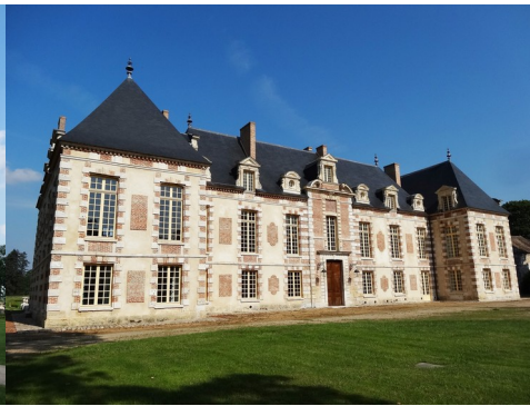
Le logis abbatial (vue rapprochée)