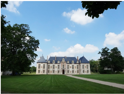
L'ancien logis abbatial, actuel château