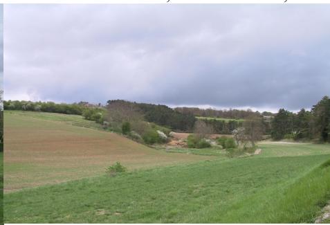
Le paysage de la vallée de l'Eure