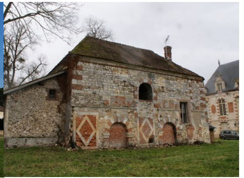
Le cellier de l'ancienne abbaye