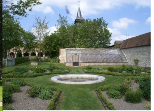
La vue sur l'église depuis le domaine

Il est préférable d'éviter les constructions qui viendraient au dessus de la ligne de paysage existante (maison à deux niveaux, bâtiments agricoles de type silo, château d'eau, éolienne...). Les projets éoliens ne doivent pas se trouver dans l'axe majeur du château à moins de nuire irrémédiablement à son caractère.