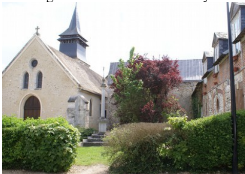
L'église de la Croix Saint Leufroy