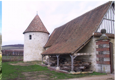
L'ancien manoir de la Croix Saint Leufroy